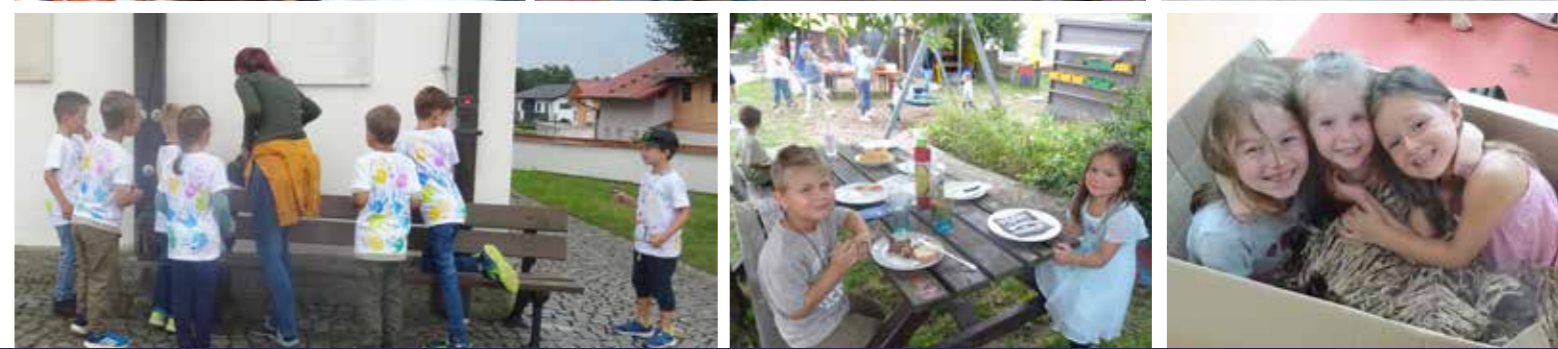
Kleinanzeigen + Vereinsnachrichten + Anzeigen